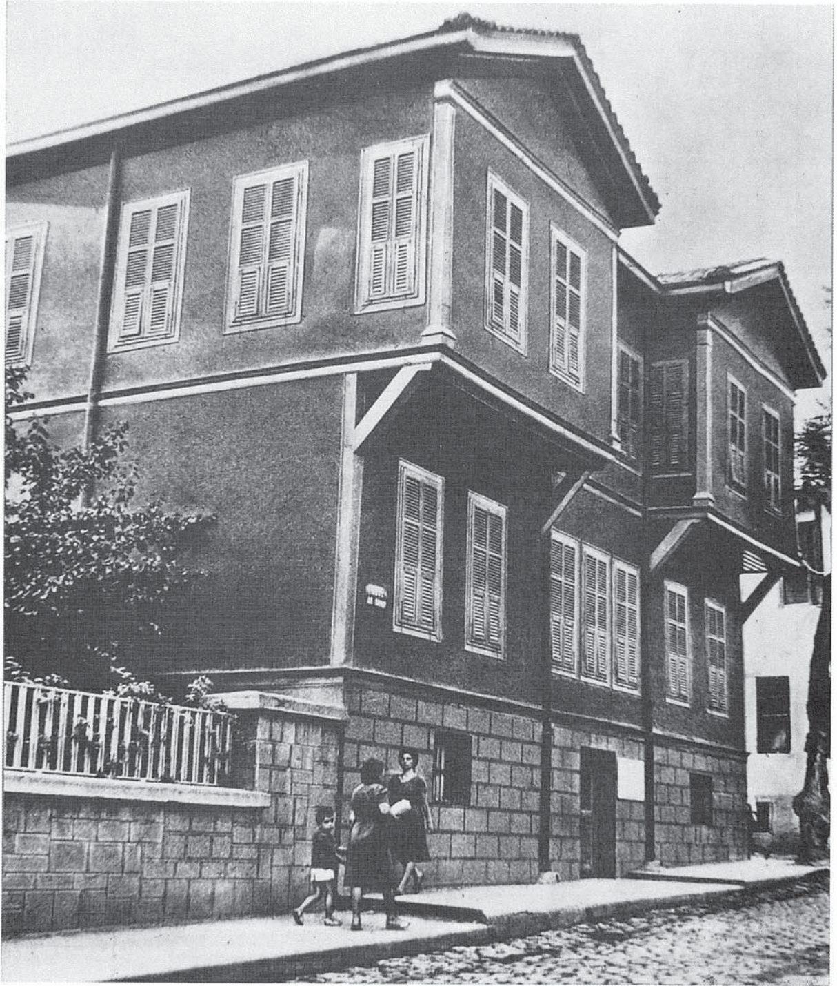
KARAMANLI SARI PAŐA